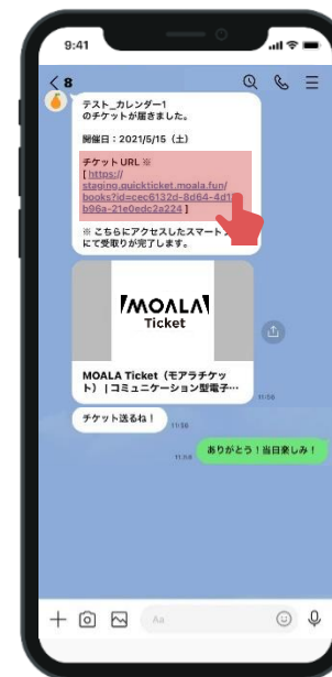
画像はLINEで分配の場合

購入者から分配を受けたチケットの場合、送られたメッセージからチケットURLにアクセスすることができます。