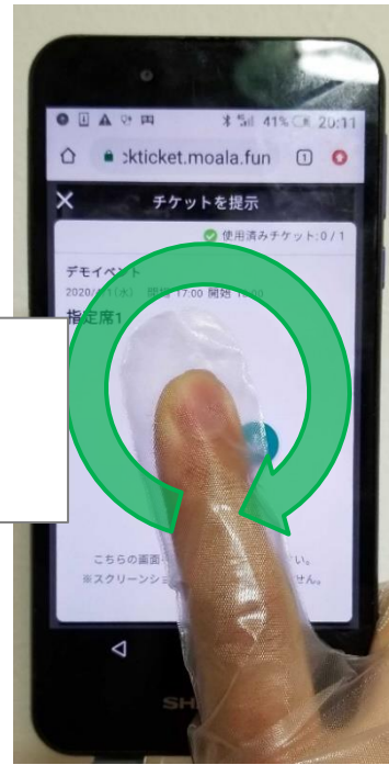
ジェスチャー操作 (指もぎり)